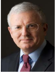
Jean Daubigny Préfet de la région Pays de la Loire Autorité nationale française